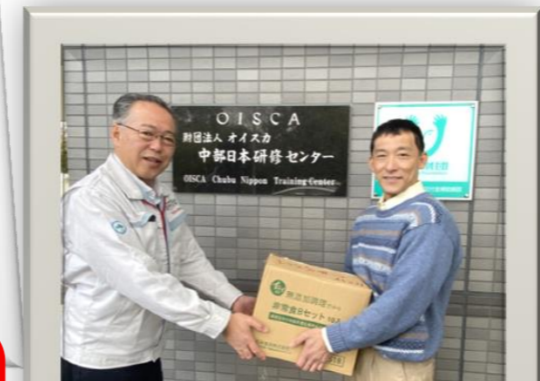
2020.1.30 公益財団法人オイスカに 外貨(30Kg)とベルマーク寄贈