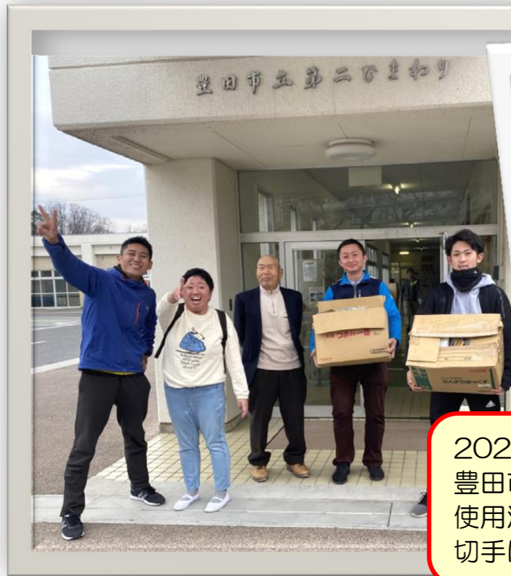
2020.1.22 豊田市福祉事業団第2ひまわりに 使用済み切手(ダンボール5箱)寄贈 切手はTUVエンドレスサークルが仕分けしました

※ カババンクに頂いたお金は、別途TUVどこでもギバー隊の収益金と共に豊田市社会福祉協議会に寄付させていただきます